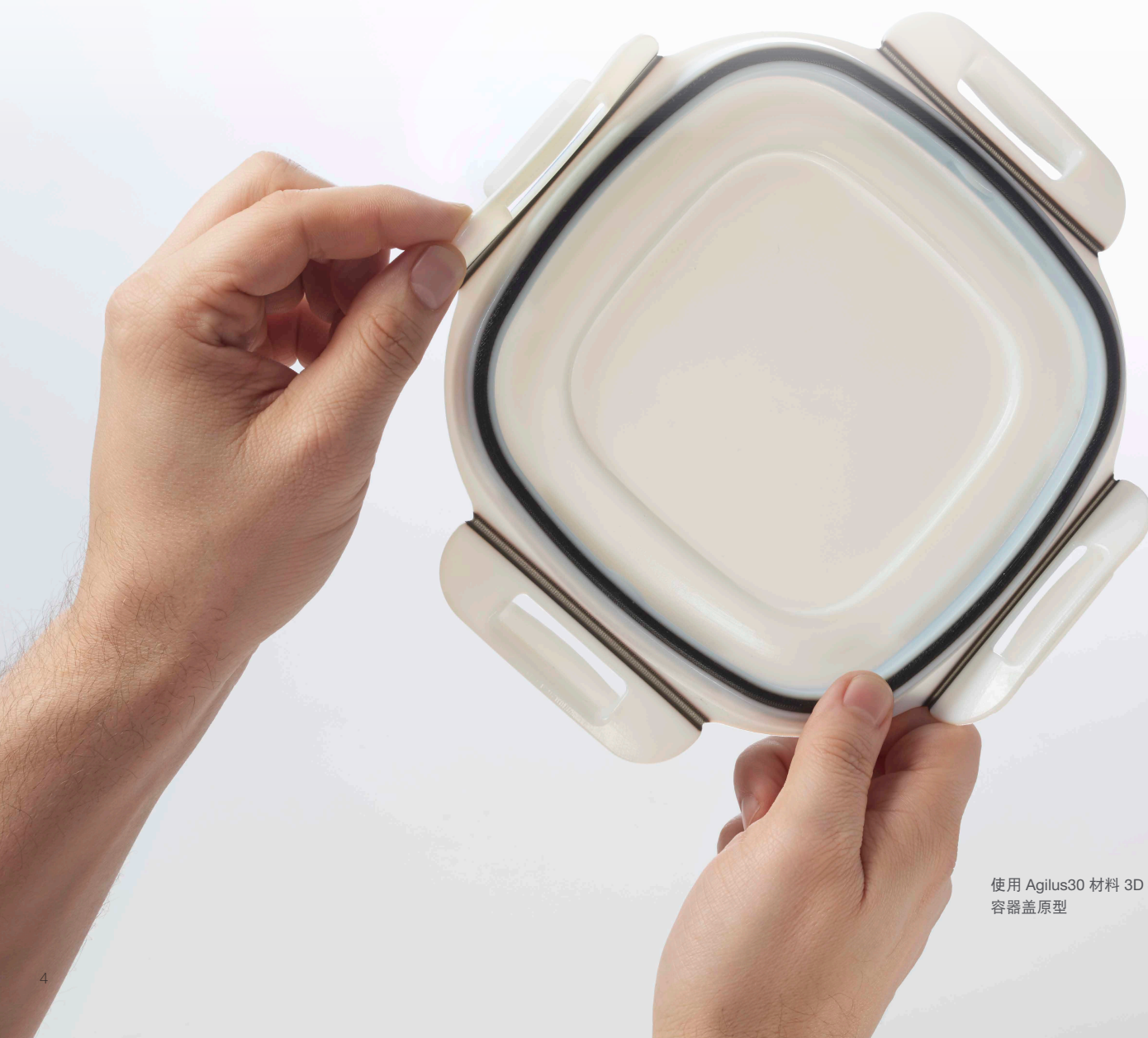
使用 Agilus30 材料 3D 打印的多材料容器盖原型