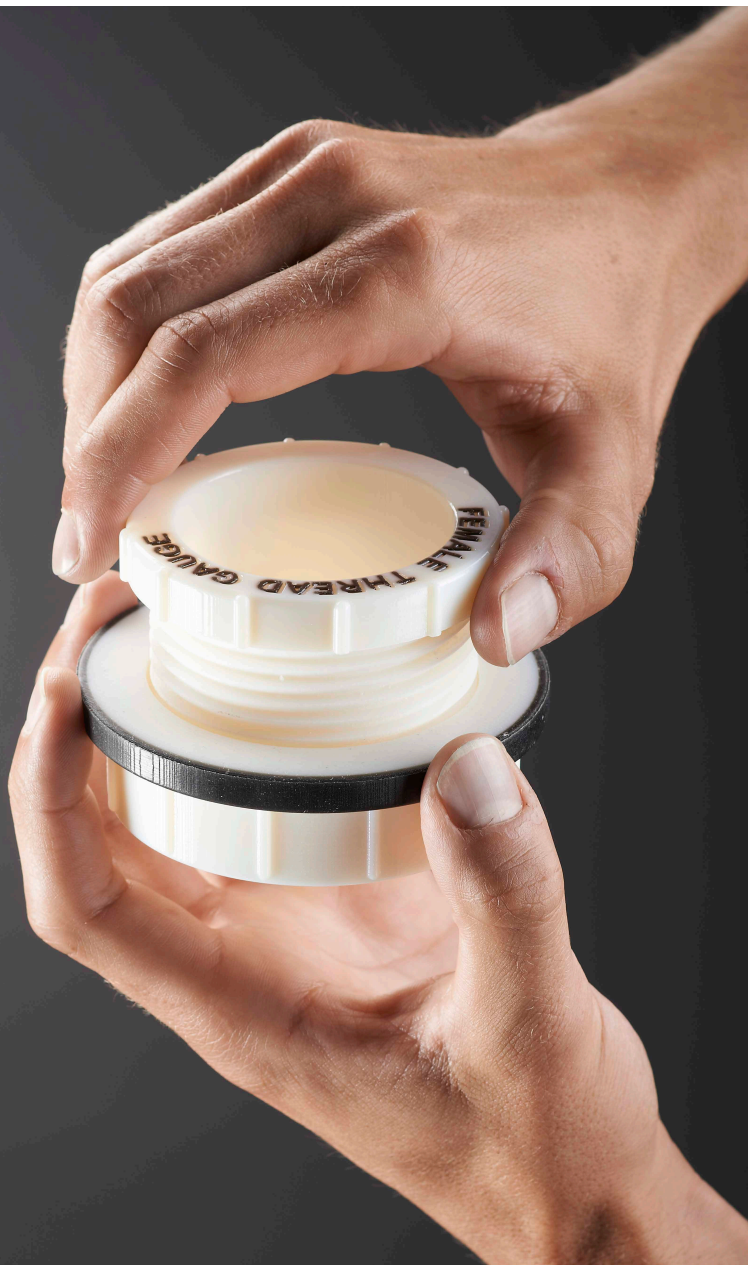
带凹凸件的螺纹规原型

使用 Agilus30™ 材料系列制作可以折弯、弯曲、拉长和密封的柔性零件及原型。