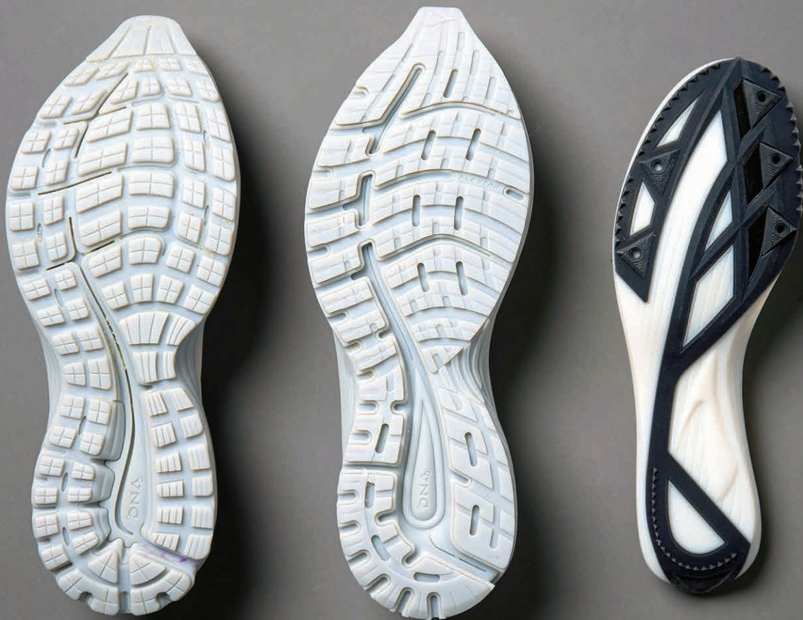
Brooks Running 3D 打印的鞋中底和鞋外底原型