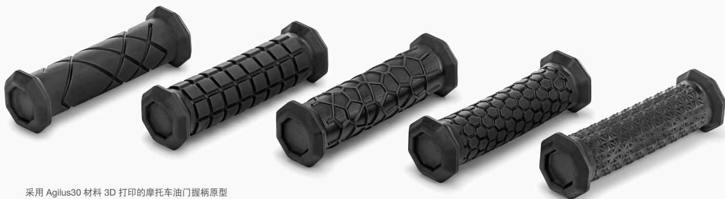
采用 Agilus30 材料 3D 打印的摩托车油门握柄原型

借助 J850 Pro，可以轻松创建功能性多材料模型，从而更快地测试和验证原型，并轻松通过利益相关者的审查。这样一来，就可以更快地做出决定和获得批准，从而帮助您完成产品验证，提高产量并节省宝贵的时间。