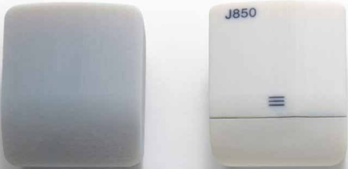
利用 DraftGrey (左) 和 VeroPureWhite (右) 3D 打印的耳塞盒原型